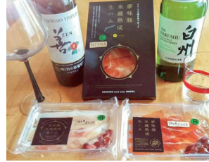
参加者は各自飲み物を用意!

今回のオンラインツアーでは、熟成具合の違う生ハムを組み合わせた特別なセットを発送。参加者はROOTsの解説を聞きながら生ハムを食べ比べました。オススメの飲み物や付け合わせの話では質問が殺到し、大盛り上がりでした!