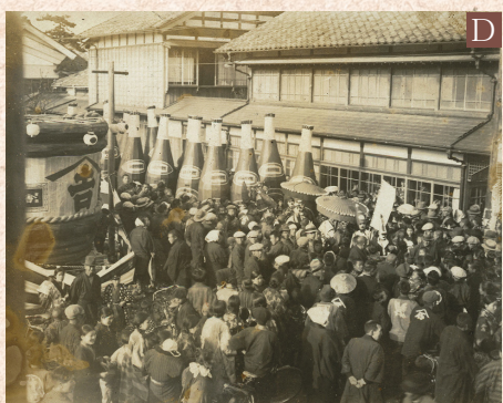
A 焼失した町 B 大火から14時間後(中央の川は中ノ口川) C 復興直後の町 D 復興祭の様子