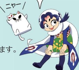
しろね大凧と歴史の館 キャラクター 大空トイカ&ねこ太

いま、集めた写真から「東京オリンピック1964聖火リレー」と「新潟交通電車線」の展示をしているよ!