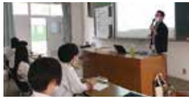
特別講義を真剣に聞きました

そもそも「観光」って何だろう?という疑問を解決するため、観光コンベンション協会から講師を招き特別講義を行いました。生徒たちが考えたツアー案を講師がチェック!「身近なものや風景が観光になる」ということを学びました。