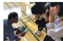
農家さんの説明に興味津々の生徒たち

いよいよ農業体験ツアー作りへの第一歩!ツアーと一緒に考えてくれる農家さんをご対面。農家さんの仕事内容や思いを聞き、新しい発見がありました。