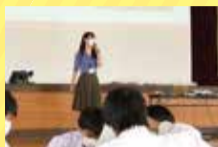
生徒へ熱い思いを伝えました

現在、白根高校2年生は、市内在住の外国人留学生に南区を紹介する農業体験ツアーの計画に奮闘しています。この取り組みは、南区の農業が外国人にとって目新しく、観光としても楽しめるのではないかと?という思いからスタートしました。生徒の理解を深め、意見を引き出すにはどうすればいいのか...などを考えながら、授業のサポートをしています。