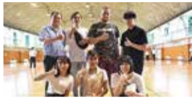
留学生とサポートしてくれる大学生

「外国人」のイメージを持ってもらうため、留学生との交流の機会をつくりました。最初は緊張気味だった高校生に対して、留学生は超フレンドリー!授業が終わるころには生徒からの「楽しかった!」という声が聞かれました。