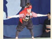
唐子人形お馬乗り