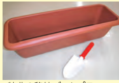
特典の移植ごてとプランター

販売場所 区民生活課 販売価格 1セット500円(基材のみ400円) ※基材:微生物により生ごみを堆肥化する基となる材料