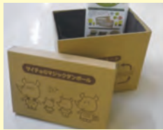
段ボール・コンポスト

南区在住の人には、生ごみを混ぜ込むときに使用する「移植ごて」と、できた堆肥で植物や野菜を育てるための「プランター」を、先着20人にプレゼントします。