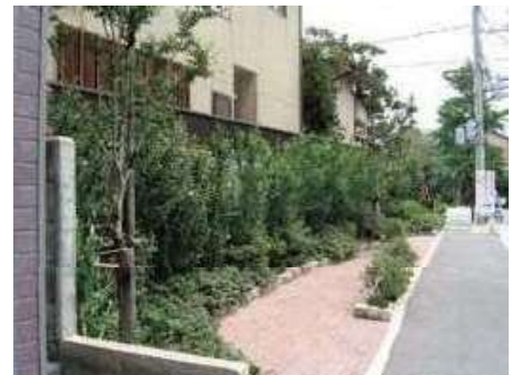
松波町ポケットパーク