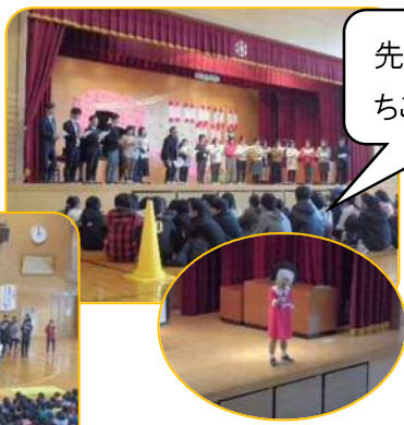
先生からも！ ちこちゃん登場