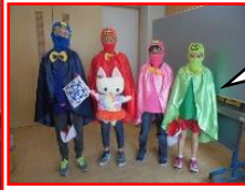
山田小学校歌四人衆です。

背中には校歌の歌詞「わが望み」「わが心」「わが仕事」「わがつとめ」の「望」「心」「仕」「務」と書いてあります。現在中学二年生の生徒が考え、地域の方が作っていただきました。