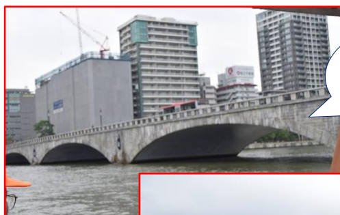
水面から見る 万代橋