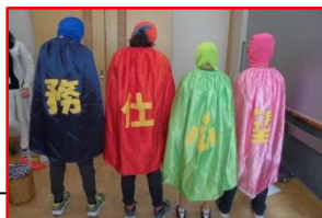
山田小学校歌四人衆です。