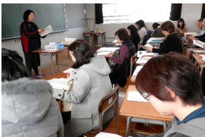
～地域の方と打ち合わせ～

地域・保護者の方々に参加を募り、地域と連携した道徳授業を試みた1日でした。よりよく生きる生き方について考える授業の話し合い活動に、ひと班にお一人ずつ6クラスで計50名を超える方に入っていました。地域の大人が生徒と一緒に考え、話し合う、はじめての取組でした。