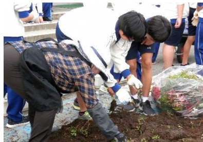
環境委員会 花植え