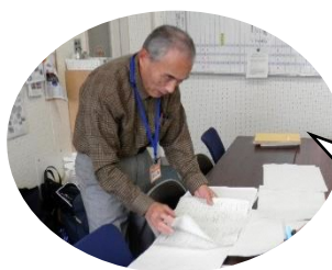
英語ボランティアさん