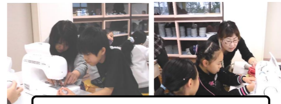
ミシンをしっかり教わりました。