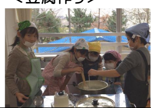
豆腐作りって大変だね。

先日, 集団下校や朝の登校を見守って下さっているボランティアさんから素敵なお手紙をいただきました。お手紙には, 坂井東の子どもたちがボランティアさんにかけるやさしい言葉や, 集団下校の時に見られた6年生のリーダーが1年生を気遣う様子, またその6年生に向かって笑顔で走ってくる1年生のほほえましい光景が書かれてありました。そして, 坂井東の子どもたちには心の優しさや思いやりの心があふれており, それを日々見せていただくことがご自身の頑張る力になるとも書かれていました。最後は「思いやりの心は子どもが周りのおとなの姿を見て身につくものだと思います。おとな自身が思いやりの心を持って行動することが大切だと思いますし, それを目指してほしいと願います。」と結ばれていました。