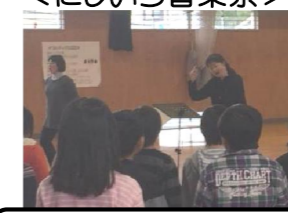
きれいなハーモニーをありがとう。