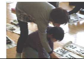
書初めに向けただいま練習中!