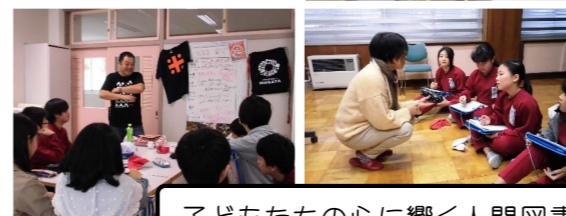
子どもたちの心に響く人間図書館でした。