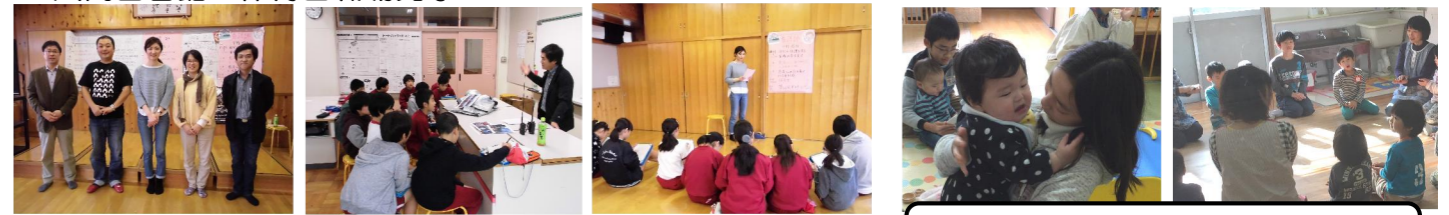
頼りになる小さな保育士さんです。職場見学。