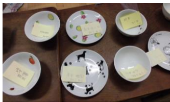
出来上がりが楽しみです。