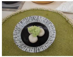
美味しそうな、白玉だんごの完成です。