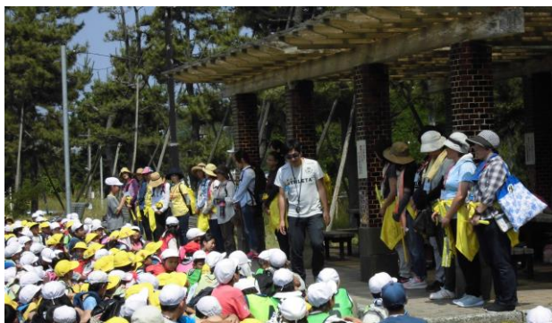
23名ものボランティアさんが参加しました。