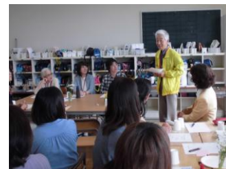
地域のみなさんもぜひご参加ください。

お申込み ・ひまわりフレンドにご登録の皆さんには、別途ご案内をお届けします。 ・保護者の皆さん・地域の皆さんは電話またはメールにてご連絡ください。