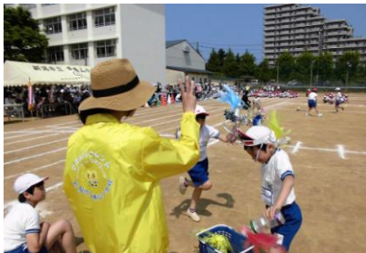
子どもたちのダンスを、厳しくジャッジ!

青空のもと、今年度運動会が行われました。ついこの間入学してきたばかりと思っていた1年生ですが、体操着姿も似合ってきて、すっかり東青山小学校の一員です。この運動会でも、ひまわりフレンドの皆さんが活躍してくださいました。ありがとうございます。