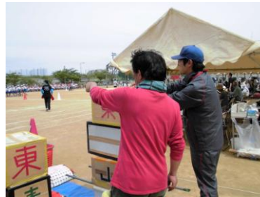
用具出し作業、しっかり打合せ中です。