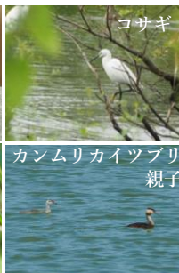
カンムリカイツブリ親子