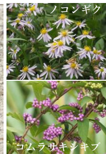
コムラサキシキブ