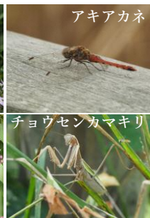
チョウセンカマキリ