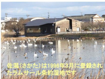
佐潟(さかた)は1996年3月に登録されたラムサール条約湿地です