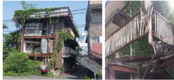
適正な維持管理が行われなくなったマンションの例