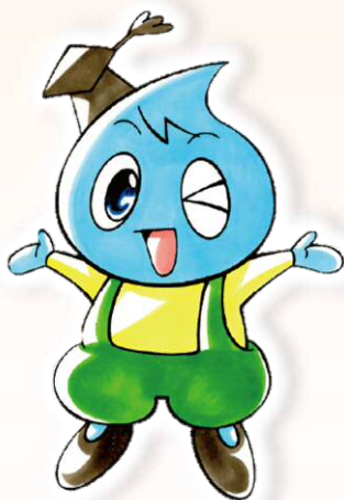
新潟市水道局 マスコットキャラクター 水太郎