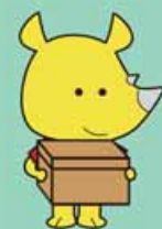
新潟市ごみ減量推進キャラクター「サイチョ」