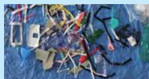
容器包装以外のプラスチック製品等