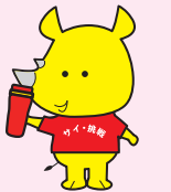
新潟市ごみ減量 推進キャラクター サイチヨ