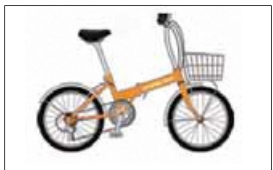
カミフルサイクルステーション コンパクト自転車 ※市内指定場所で 受け取り可能な方のみ