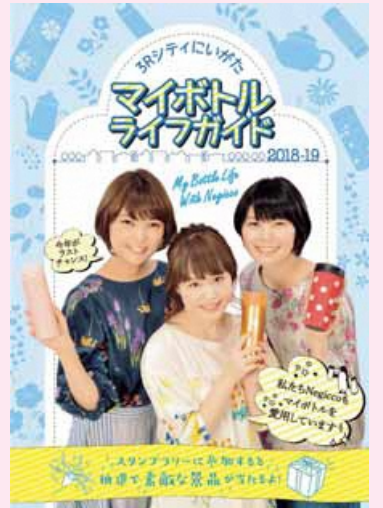
マイボトルライフガイド