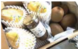
いわおろや 季節の野菜・果物 (加工品含む) 詰め合わせセット