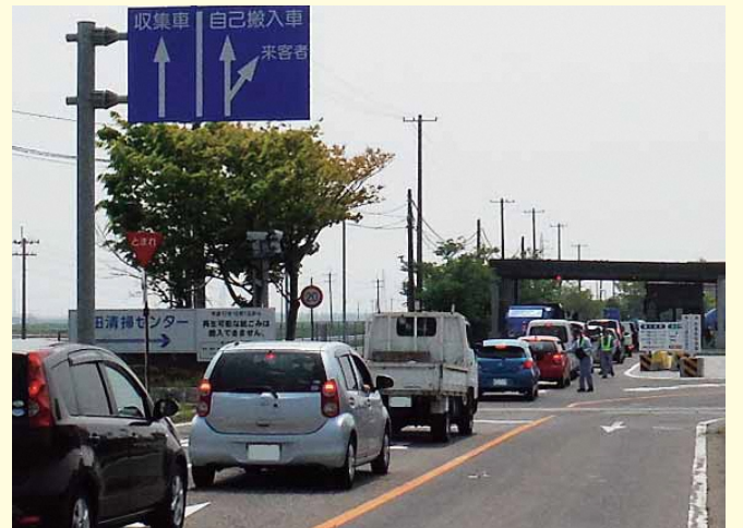
自己搬入の混雑状況(平成30年5月1日)

※特に年末年始・お盆・引越しシーズン・連休の翌日・土曜日は自己搬入が多く、混雑が予想されますのでご注意ください。