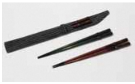
新潟漆器「萬代筆」 (亀田縞箸袋付) ※色は選べません

同時実施中の 省エネキャンペーンからも 抽選に応募できます! ぜひご参加ください!