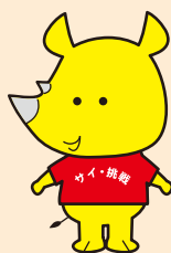
新潟市ごみ減量推進キャラクター サイチョ

リユース食器とは、使い捨て容器の代わりに、洗って何度も繰り返し使える食器のことです。