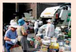
集団資源回収の様子