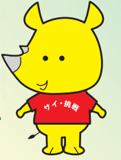
新潟市 ごみ減量推進キャラクター サイチヨ