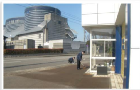
毎週月曜日は「社屋周辺清掃活動の日」