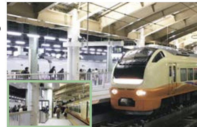
新幹線と在来線の同一乗換ホーム (左下：乗換の様子)