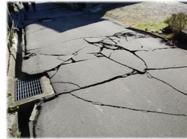
対象となる道路(被害)の例