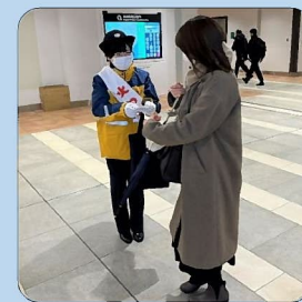
歳末防災強調運動に伴う 新潟駅での街頭防火広報