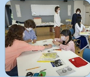
定例会を年4回程度開催し 意見交換を実施