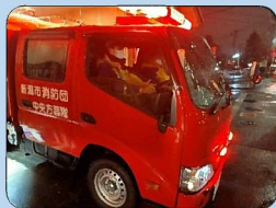
消防車両による防火広報