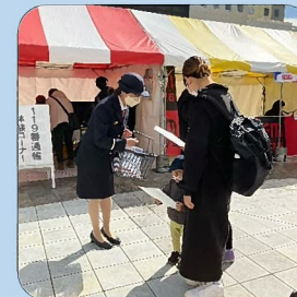
秋の火災予防運動に伴う 万代シティでの街頭防火広報