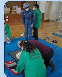
自主防災訓練などで地域の方に 応急手当を指導