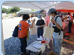
各種広報活動で市民への火災予防や入団促進の呼びかけ

中央区の専門学校に在籍する学生も学生消防団員として市民に火災予防を呼び掛けています。