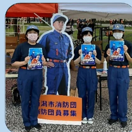
消防団員募集の広報活動