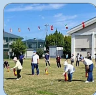
地域住民への消火器取扱いの指導や防火広報活動