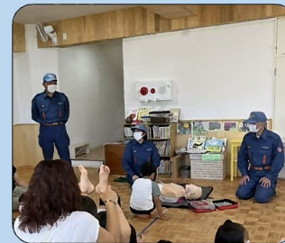
子供たちへの応急手当講習