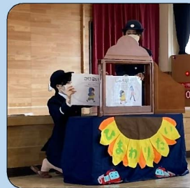
保育園や幼稚園での紙芝居による防火教育

保育園や幼稚園を訪問し、幼児に正しい火の取扱い方について紙芝居などを活用し防火教育を行っています。