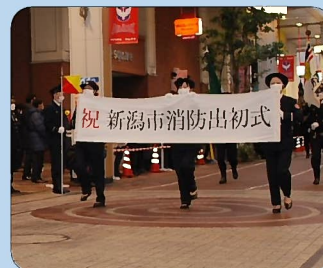
消防出初式の分列行進に参加