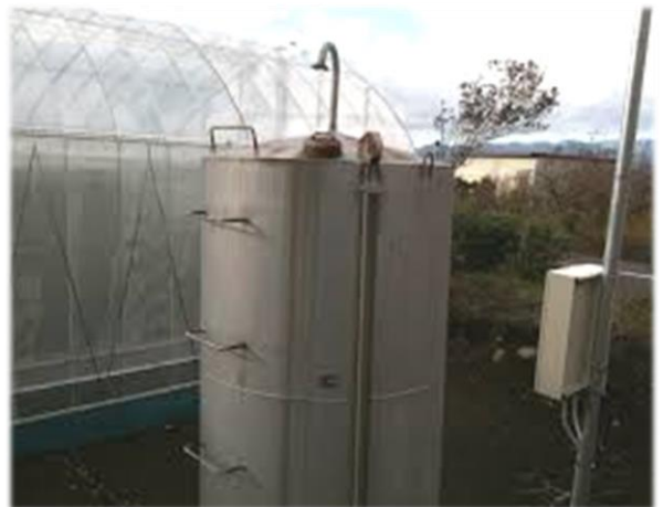
代表的な油類の指定数量（危険物の規制に関する政令 別表第3より抜粋）