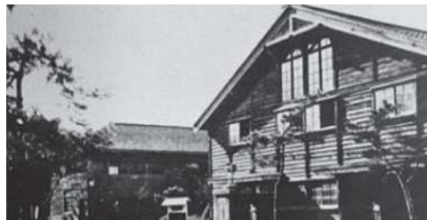
小須戸小学校は、大川前4の児童公園の場所にあった。