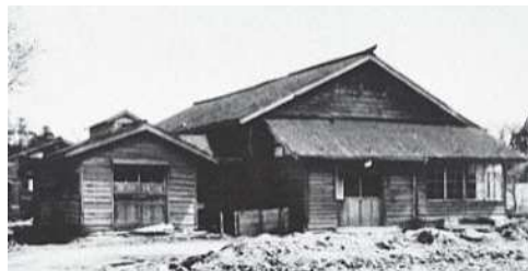
横水小学校は、小向の横水保育園（現在のほほえみ作業所）の場所にあった。