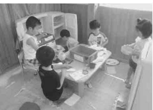
「おうちごっこ」 “ごはんですよ~!!”

「遊ぶ・食べる・寝る」という基本的な生活リズムの繰り返しの中で、子ども達が、毎日生き生きと過ごせるよう、保護者との連携を図り、家庭において「できること」から実践していただけるよう、必要な情報を発信していきたいと思っております。