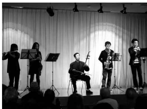
初の共演。吹奏楽と胡弓の演奏