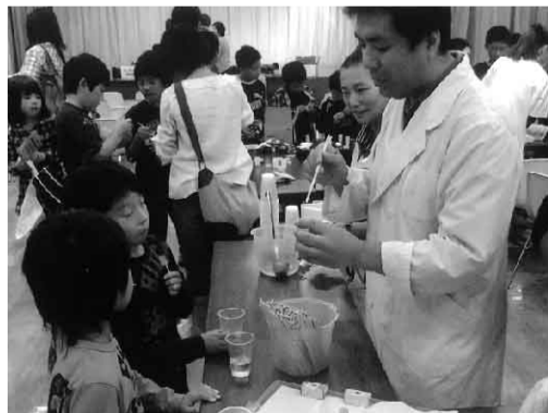
列がとぎれないスライム作り