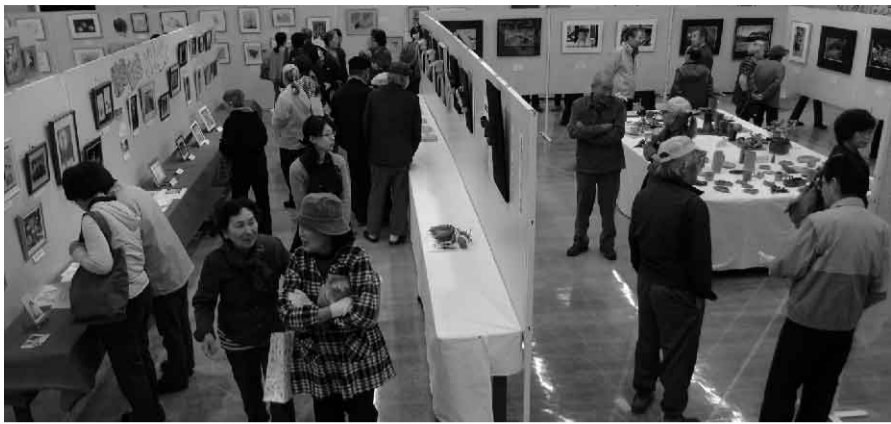
和やかな雰囲気での市民展メイン会場（3階・ホール）