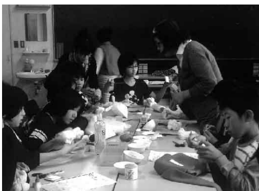
タオルで犬のヌイグルミ作り