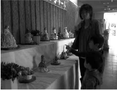
「あつ、おばあちゃんのだ!!」