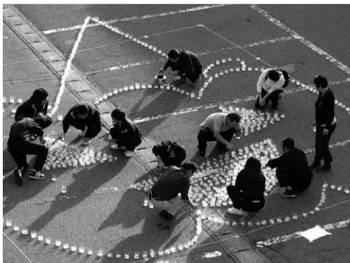
中学生のボランティア大活躍

秋の夜長のひととき、家の灯りを消して公民館に集い、震災の早い復興を祈り、3.11以降の日本のエネルギーを真剣に考える機会にと、小須戸小学校区コミュニティ協議会が公民館の協力の下、年一回開催する企画でした。お陰様で無事成功裏に終えることが出来ました。 秋晴れで、多くの家族連れや近くの介護施設からたくさんのお年を召した方々の参加もありました。