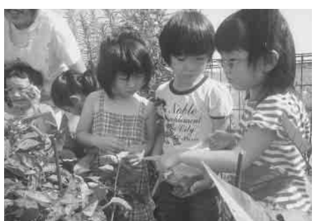
「おいしいそうなピーマンだよ!」 “あっ!ピーマンみつけた”

元気に遊ぶ子どもがいる一方で、朝食を食べない子、朝からあくびをしている子など、基本的な生活習慣の乱れが、無気力や体力の低下に繋がっているようです。