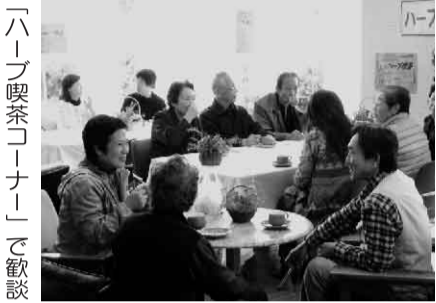
「ハーブ喫茶コーナー」で歓談