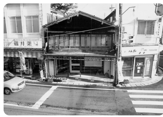
「町屋ギャラリー薩摩屋」の外観

日時 十二月十五日(水) 十二月十八日(土)四日間 午後一時～午後五時まで 小須戸写真クラブの皆さんの写真展が開催されます。 (無料)