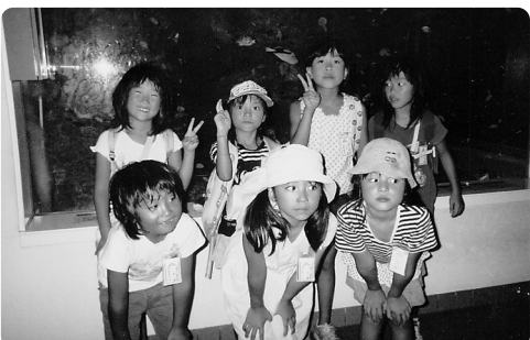
水族館に来ています。きれいな魚が沢山いるよ。