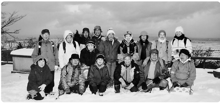
みんなで、ご来光を拝みませんか(今年の様子)