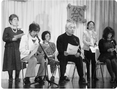
初出場、「朗読あきは」による、にいつの昔話