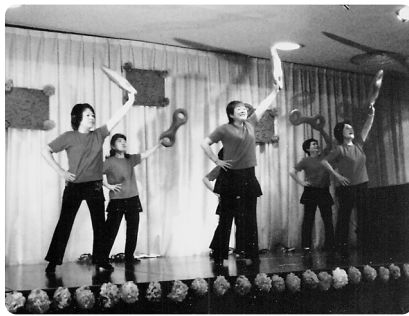
3B(さんびー)体操初登場。陽気にダンシング。

る「小須戸甚句」は地元郷土民謡の魅力が大勢の聴衆から知ってもらった。⑧「四季の新津」、「新津松坂」は、小須戸にいながら品のある新津の風情を感じさせてくれた。