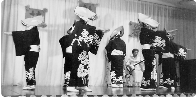
「新津松坂」で、会場全体が静まりかえりました。