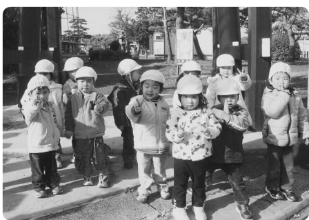
散歩コースの穴場を教えてください(保育園より)

小春日和のある日「〇〇へ散歩に行つてきます」という保育士の声が次から次へと聞こえ、外へ出掛けて行きます。その形態はベビーカー、お散歩ロープ、友達と手をつないでなど様々です。 『うららこすど』へは歩道があつて安心。道の脇には春から咲いている色とりどりのペゴニアが子ども達の目を惹かせてくれています。 田んぼ道へのお散歩も、行く度に新しい発見や体験をし何かしらのお土産を持つてきます。