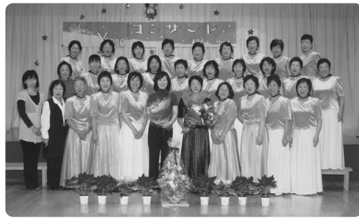
コンサートが無事終わり達成感の笑顔

十二月とは思えない快晴の昼下がり、クリスマスコンサートが開かれました。百二十人を超えるお客さんが集まる三階のホールでコールあじさいのコーラスで幕があがり、おはなしほけつとによる絵本の朗読、コーラスラベーターと続きあつという間に一部が終了。主催者側の配慮でお茶などのサービスもあり十五分の休憩の後、コーラスラベーターから二部がスタート。ア・カペラヴォカリーズ、主催の二つのグループによる息の合った迫力のある合同演奏と続き、最後に総出演者とお客さんとの会場一体となった大合唱。