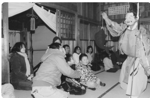
矢代田神社での鯛釣りの神楽舞で初笑い