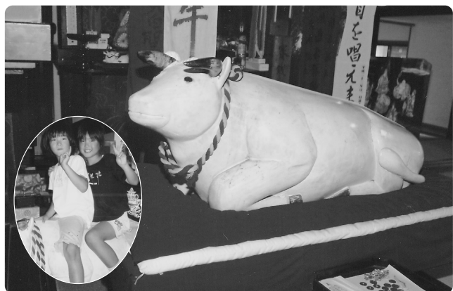
大喜びの子ども達

今年の干支の「うし年」にちなんで、天ヶ沢の感応寺にまつられてある「子守り牛」を紹介します。 同寺のご住職によればこの子守り牛は「子どもを災いから守り、子どもの成長を願う牛」と言われ続けられています。 また、この牛に子どもがまたがると、健やかに成長するとか、牛の体をさすると体の悪いところが治るなどの言い伝えもあります。 最後にご住職は「いつでも来てもらって、子守り牛をお参りできます」と、快く話して下さいました。