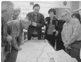
楽しく昔をみんなで語っている様子

参考 新潟県の道路元標 http://konomi.nagaokaut.ac.jp/~masui/road_genpyo.html