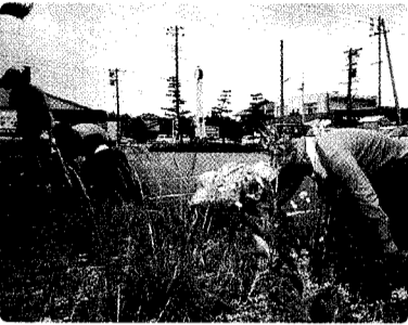
28日 天理教草取り作業奉仕