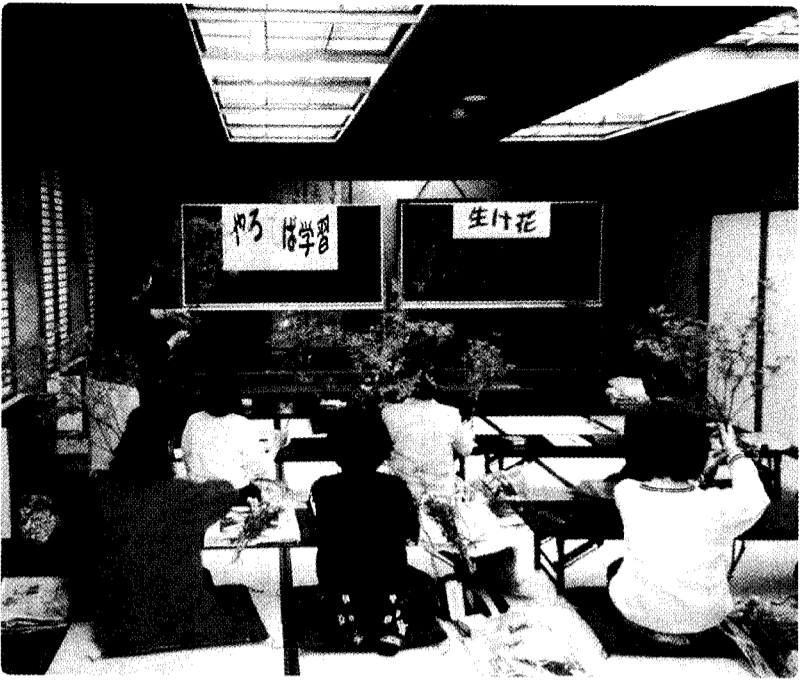
初めての生け花学習

四月に配布いたしましたやるてば学習ガイドは小須戸町生涯学習推進会議で話し合われた内容の一つです。次にやるてば学習とは何なのか、何をめざしているのか説明いたします。