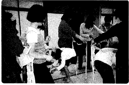
親子チャレンジ教室・室内ゲーム

主な内容は、「町外の施設見学」「親子ゲーム」「ミニ遠足」「講義・家庭教育」など子どもと共に成長する親となるための学習の場です。