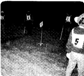
グランドゴルフ大会より

でなければ何とかが、一別に抵抗もなく生きてこれたのではないのでしょうか。また、そんな経験があればこそ今の恵まれた幸せにつくづく感謝できると思っています。この間も孫の中学生は東京へ、一年生は秋葉山へと修学旅行に出かける嬉しそうなお姿を見て、よい時代であることに感謝し、喜びの日々を過ごしています。