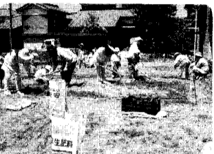
25日 親子チャレンジ教室 「暑さの中フラフラになつての畑 つくり、みんながんばったネー」