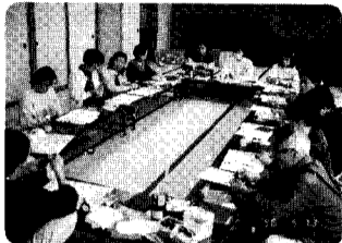
13日 折り紙教室 「花」を折っているところです。 完成まで、もう少しです。