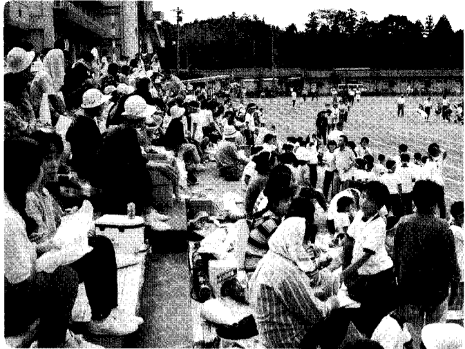
さあ、皆さん!! 健康づくり、仲間づくりのため、気軽にスポーツをやってみませんか!

町民憲章で定められているように、町民が健康で明るく豊かな生活を形成するためには、町民総参加のスポーツ活動の普及や体力づくりを通じた生涯にわたる健康づくりが重要です。今回は、生涯スポーツについて考えてみましょう。