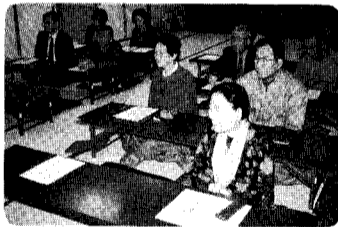
10日 おもしろ雑学講座 地域おこしについてを勉強している皆さん。