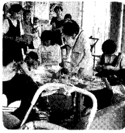
家庭教育「つくしんぼ」

四歳から六歳までの子を持つお母さんを対象とした幼児家庭教育学級です。お母さんを中心とした活動を行っています。