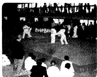
県外参加もあり、盛大な大会となりました。

十一月十二日(日)に町民体育館において、第四十回記念県下柔道大会が開催されました。今年には記念大会ということで県外から小学生高学年の部で十チーム、低学年の部で十チーム、中学生の部で四チーム招待して行なわれました。特に小学生低学年、高学年の部は決勝トーナメントから他県チームとの対戦になり、全国大会さながらの熱戦が行なわれました。大会結果は次の通りです。