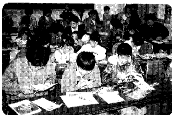
11日 親子チャレンジ教室 今日は紙飛行機だー!! この後、みんなで飛行機を飛ばしました。