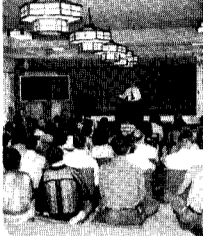
成人教育「生きがい講座」

社会福祉協議会との共催事業で福祉ボランティアの育成だけでなく、研修・手話大会等積極的に活動しています。