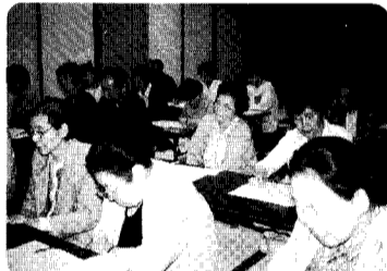
色々な年代の方が学習しています。

もちろんあらゆる分野にわたつての要望に応えるのは無理なことですが、内容によっては地域の町民同士での学習と指導の相互支援体制が出来るような生涯学習をめざしたいと考えています。