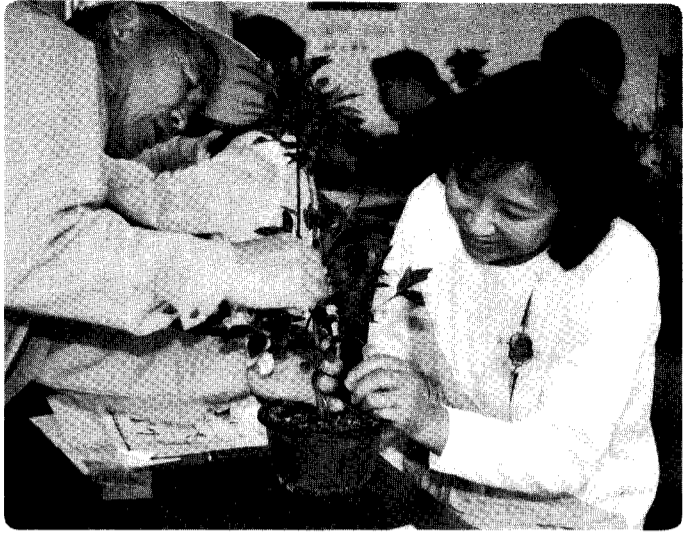
「花が好きで学習の場に参加しています。」 キツカケは身近かなところで生まれます。