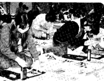
「それ、手本です」写真を撮って逃げてきました。

「俺の方がうまいや、へへへ」聞こえてきます。いろんな声が一年、二年は教室でクレヨン鉛筆などで、三年から六年が体育館で「書きぞめ」なのだそう。