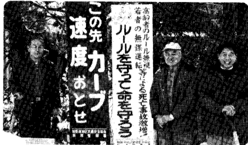
この先カーブの速度おとせ、ルールを守って命を守ろう。横水地域の交通安全推進委員会が主催する交通安全教室の様子。

横水地域は昨年十月、新津警察署管内の「交通安全モデル地区」に指定されました。横水地域では残念ながら死亡事故が多発している事もあり、交通事故を無くすために地域ぐるみで積極的に取り組む事になりました。まず十一月に四地区の区長を中心に、各団体の代表を役員として交通安全推進委員会を充足させま