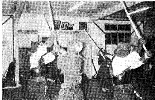
今年も元気に寒げいこ 恒例の柔剣道寒げいこが、去る2月2日から11日まで行われました。特に今年は厳しい寒さでしたがみんな元気に励んでいました。