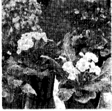
鉢物草花の手入 豪雪の中ではありますが、さすがに日射しも春らしくなってきました。