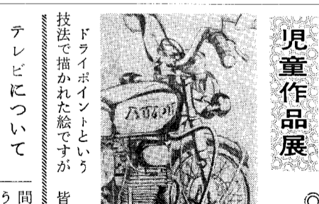
次回是小須戸小学校の皆さんの作品です。