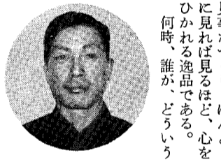
私のかからもの名刀

にすつと来て来た寝坊助の吸いが、ジュースを飲んでも、足の踏み場もないほど、奥の紙屑は去年からのものようです。 町の玄関側のごみ置き場、何んとか自主的に管理できないものでしょうか。外に置かれた自転車の主も、あながち置場がないからと、ごみ置き場の中に置く気になれない、けつべき漢か、さもなければ奥へ入るの、おつくりの無精者が朝寝で飯も食わず