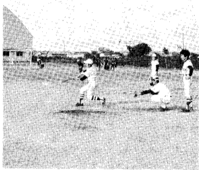
スポーツで心身を鍛えよう

といったところで、その他未発見のものも加えれば、恐らくこの数倍に達するのではないかと想像される。その上、年齢層がだんだん低下して小学生にまで及んできている。 懇談にうつってからは、今後の重点対策について活発な意見の交換がなされた。最終的には、まずシンナー遊びを撲滅する。 ・スポーツ、奉仕活動等で健全育成に力を注ぐ ・専門委員会を設け具体策を立てる これからの青少年協会の活躍に大きな期待を望むものである。