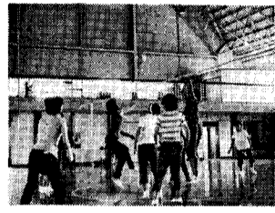
(体力づくりの一環 ママさんバレー)

私も民謡保存協会もお蔭で満三年を迎えることができました。楽しく踊る会のモットーに、精一杯の練習を重ねて参りました。これも偏らにご家族皆様のご理解と町長はじめ町民皆様のご支援の賜と深く感謝申し上げます。 指導 町民体育指導員 小須戸町公民館 教育委員会