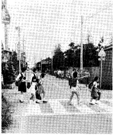
よい子はみんな手を上げて