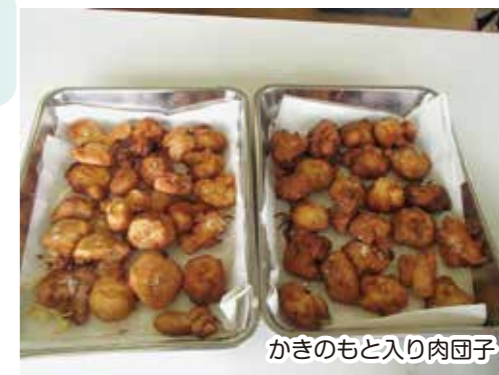
かきのもと入り肉団子