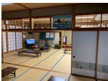
中広間から大広間