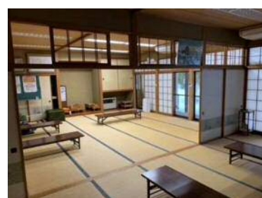
大広間から中広間