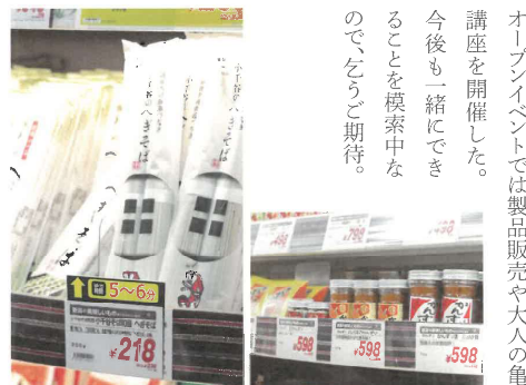
かんずり、そばなどは種類が豊富。お土産にも便利。

さっそく亀田縞の組合に相談に行きました。オープンイベントでは製品販売や大人の亀田縞講座を開催した。今後も一緒にできることを模索中なので、乞うご期待。