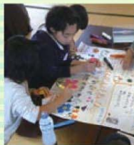
小学生とのワークショップ開催