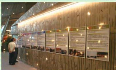
市民活動紹介パネル展示

また、区ビジョンまちづくり計画が始まり平成27年・28年の実施計画も示されました。これらの計画についても、確実に実施されるよう部会で調査してまいります。