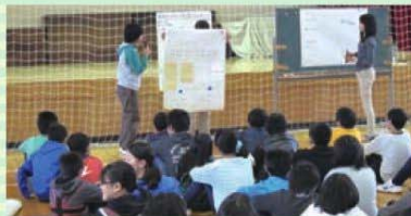
小学生とのワークショップ開催

まずは、亀田地区において、地域を花で飾り、きれいなまちをつくる取り組みを行い、他の地区でも実現可能なものから実施してまいります。