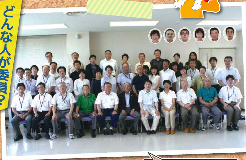
事務局(区役所職員)と一緒に。