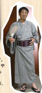
亀田織のゆかたを着てポーズ。