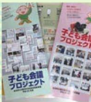
リーフレット作成