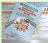
買い物支援パンフレット作成