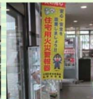
火災予防のぼり旗作成