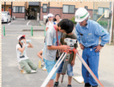
亀田西小学校児童による測量体験

平成24年度より区内の小学校高学年を対象とした、地域の地勢を知り、標高を測量し、海拔看板を設置する事業を実施し、昨年度までに、区内10小学校すべてで測量体験をしました。今後、希望校の継続実施が行える道筋ができたと思っております。