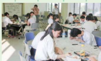
中高生応援スペース検討ワークショップ

他都市の取り組みを参考にしながら検討を重ねていく中、自治協議会委員からも「中高生が夢を持てるようなしなげづくり