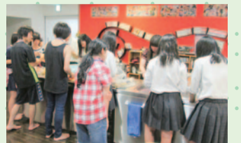
CHUKOらんどチノチノ視察・交流(茅野市)