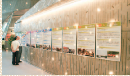
パネル掲示(江南区文化会館)

日本中で高齢化がすごいスピードで進行しています。我が江南区でも他人事ではありません。まちづくり部会では住民の皆様が生活する上で買い物の支援が必要なのではとの考えから、曾野木地区をモデルにアンケート調査を実施いたしました。その結果、現在は家族の応援などで何とかやれてい