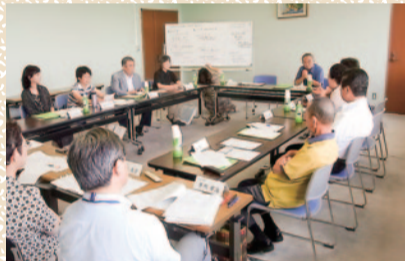
部会の様子(プロジェクトの内容などについて審議)

子どもの行動範囲は限られていて、自分の住む地域を完全に知るといことは難しい面もあると思いますが、大人に寄せる期待や地域の美化運動などには厳しい注文がよせられました。