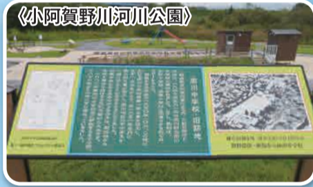
〈小阿賀野川河川公園〉