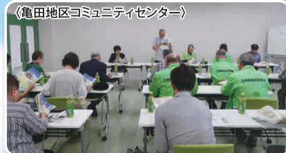
〈亀田地区コミュニティセンター〉