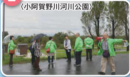
〈小阿賀野川河川公園〉