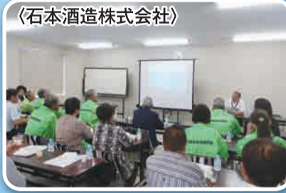
〈石本酒造株式会社〉