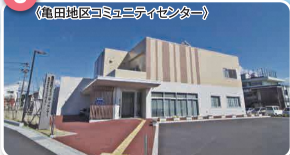
〈亀田地区コミュニティセンター〉