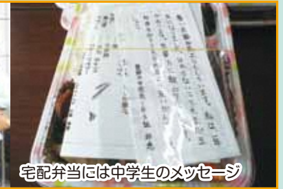
宅配弁当には中学生のメッセージ