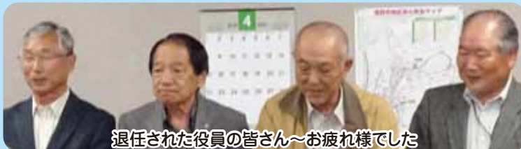
退任された役員の方皆さん～お疲れ様でした