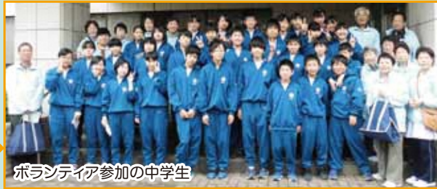
ボランティア参加の中学生