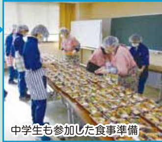
中学生も参加した食事準備