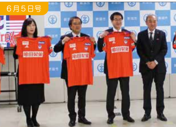
アルピレックス新潟ユニフォーム贈呈式

3年ぶりの開催となり、初めての子も、経験のある子も楽しく花を挿しながら交流できました。