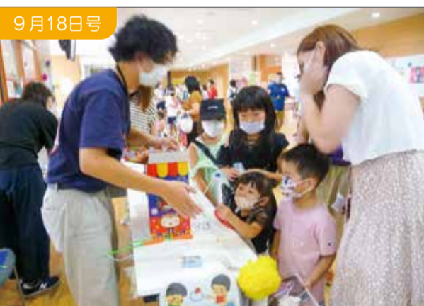
きらとびあ夏まつり

江南区を拠点に活動する硬式野球のクラブチームが予選を勝ち抜き全国大会に出場しました。