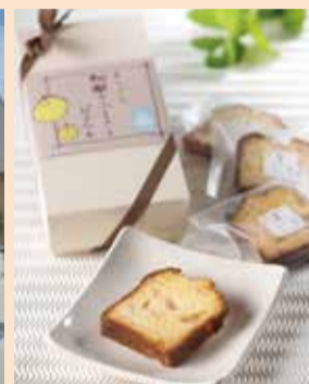
えんではよごし 和梨のふるさとパウンドケーキ