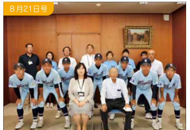
新潟江南リトルシニア全国大会出場

7月にオープンしました。木の香りが漂う素敵な建物です。フリースペースもあります。