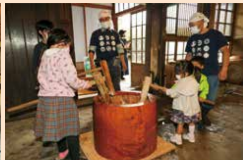
伊藤家伝統・三人もちつきの体験