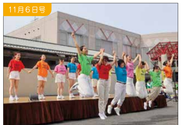
こうなんふれあまつり オープニングセレモニー

小阿賀野川河川公園屋敷広場で、初めて開催し、モツゴなどの魚を釣り上げていました。