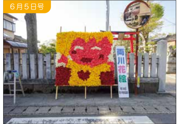
両川花絵プロジェクト

育てて食べよう家族でチャレンジと題して、種まきから収穫まで体験してもらいました。