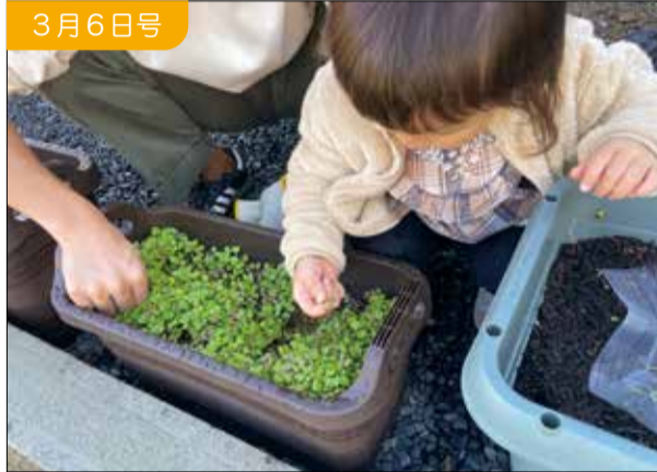
だれでもできるプランター栽培

亀田線を座席に使った観光電車を提案した作品が最優秀賞に選ばれました。(令和3年度事業)