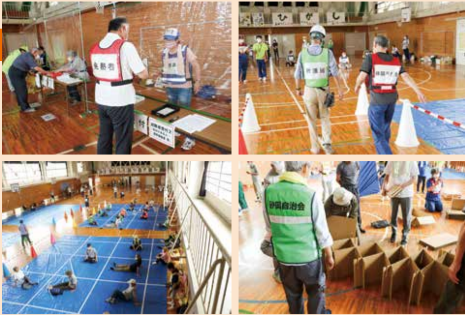
左上:体調不良者を分けて受付 右上:救護班が体調不良者を別室に誘導 左下:2mの間隔をあけて避難 右下:ダンボールベッドの使用方法を講習