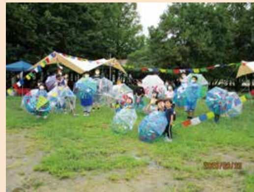
世界で一つだけのマイ傘アートが完成しました