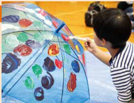
お気に入りの絵を描きました