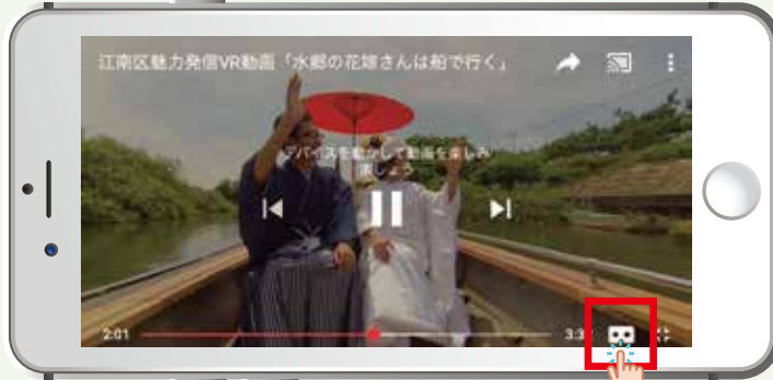
③2画面に切り替わったらVRゴーグルに装着します。