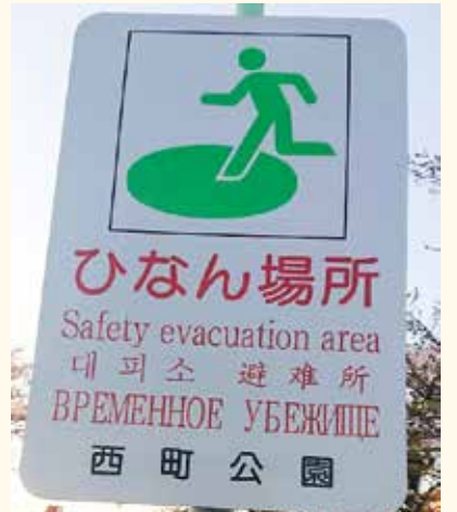
避難場所看板の例