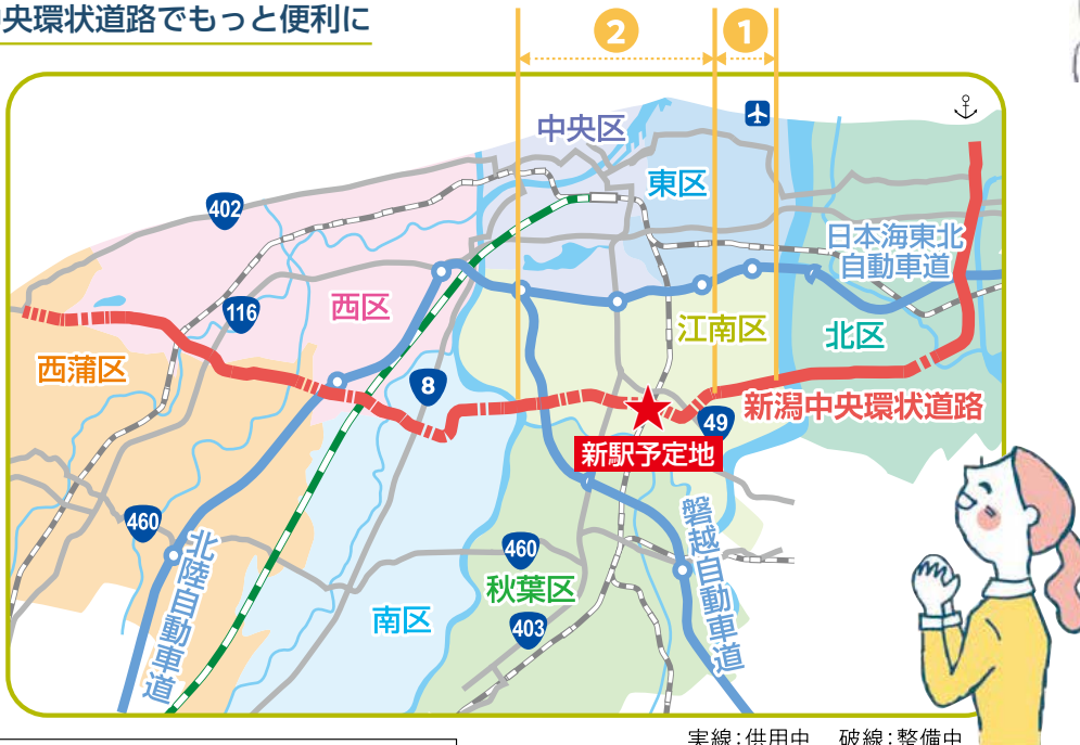
実線：供用中 破線：整備中

新潟中央環状道路と交わる位置が整備予定地となっており、自動車から電車に乗り換えることで、広域からスムーズに中心部へ移動できます。