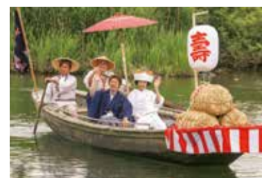
(昨年)写真コンテスト 小阿賀花嫁大賞「最高の笑顔」